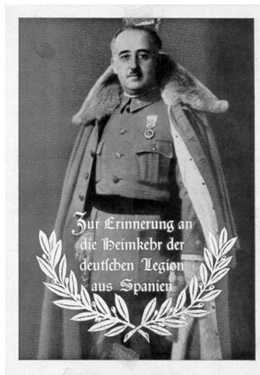
„Zur Erinnerung an die Heimkehr der deutschen Legion Condor aus Spanien“ 92