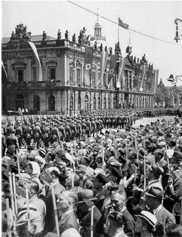
Parade der „Legion Condor“ am 6. Juni 1939 in Berlin 95