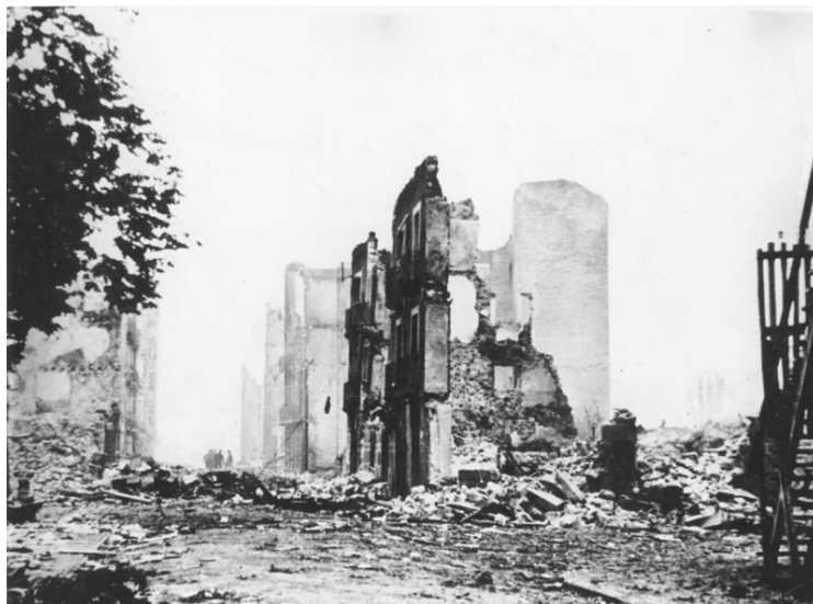
Guernica, 26.4.1937 96