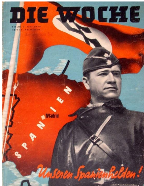
„Unsere spanischen Helden!“ 91