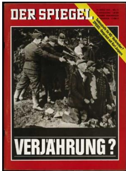
DER SPIEGEL 11/1965 77

„NS-VERBRECHEN / VERJÄHRUNG. Gesundes Volksempfinden Den Bösen sind sie los, die Bösen sind geblieben. Johann Wolfgang von Goethe, Faust I.