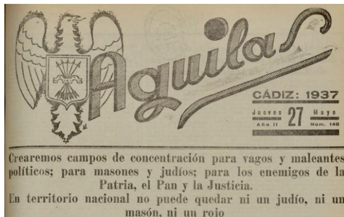
„Aguilar 89 , Cádiz: 1937, Jueves 27 Mayo“ (Adler, Cádiz, 27.5.1937) 90